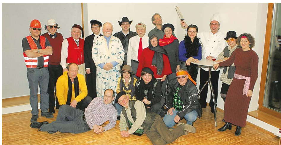
Der Kirchengemeinderat in dezenter Verkleidung