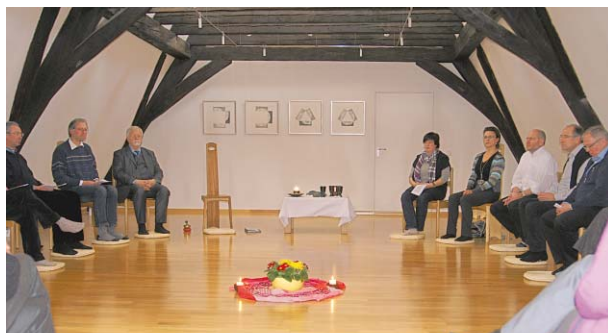
KGR beim Abendmahl

Es war die dritte Klausur in der 6-jährigen Amtsperiode des Kirchengemeinderats und man spürte, dass das Gremium zusammengewachsen ist und gut miteinander kann. Es herrschte eine entspannte, fast familiäre Atmosphäre, Vertrauen untereinander und eine große Offenheit in den Gesprächen.