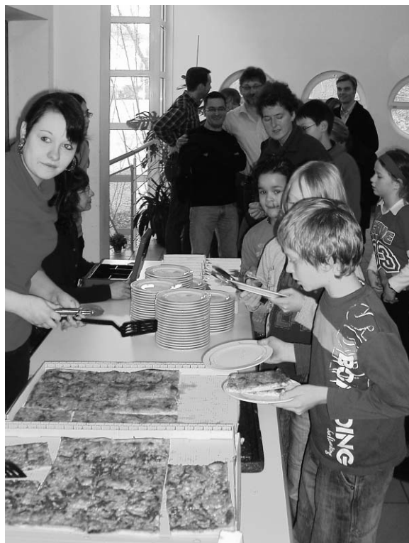
... und hinterher 'ne Pizza ...

Und für die Mitarbeiter ist es nach wie vor faszinierend, dass auch nach 10 Jahren dieser Gottesdienst immer noch durch Ehrenamtliche auf die Beine gestellt wird und Spaß macht. Rückblickend sagen wir „Gott sei Dank“ für gute Gemeinschaft, wertvolle Impulse für den Alltag und dass bis heute alle Kinder immer noch Pizza mögen. Am 18. September 2011 feiern wir unseren Jubiläumsgottesdienst, in dem wir Rückschau halten auf die 10 Jahre seit der Gründung. Thema des Gottesdienstes ist „Nimm Zwei oder Drei“. Die